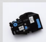
チューブウォーマー