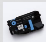
チューブアタッチメント