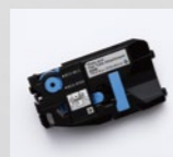
記名板・フラットチューブアタッチメント