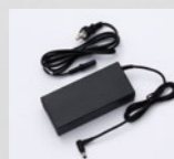
ACアダプター・電源ケーブル