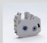
インクリボンICカセット白(85m)